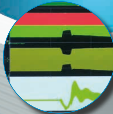
Generatorrotorwinkelmessung Misura angolo di rotore dell'alternatore

Fähigkeit, das Netz im Falle eines Kurzschlusses zu unterstützen