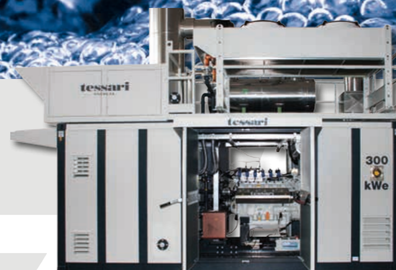
Sistemi di cogenerazione per il Grid Code tedesco Kraft-Wärme-Kopplungs-System gem. Mittelspannungsrichtlinie

Efficienza, Qualità, Affidabilità Effizienz, Qualität, Zuverlässigkeit