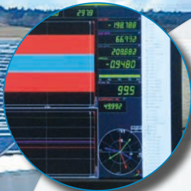
Analyse Gerät Strumento di analisi